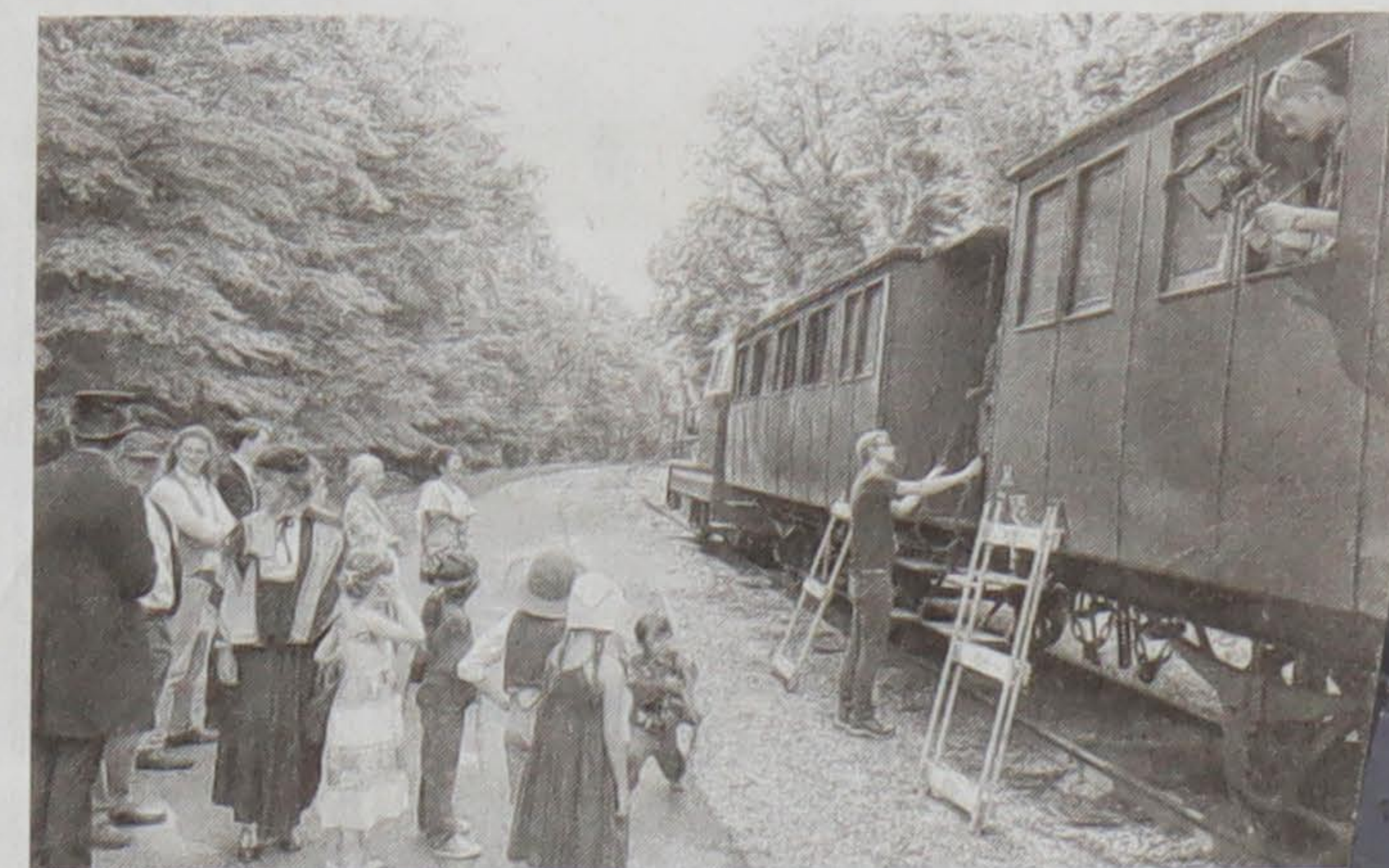
Les acteurs patientent pendant que l'équipe technique installe le matériel de tournage dans le train.

Le format court est particulièrement adapté à ce scénario, puisqu'il correspond à peu près au temps d'une histoire du soir.