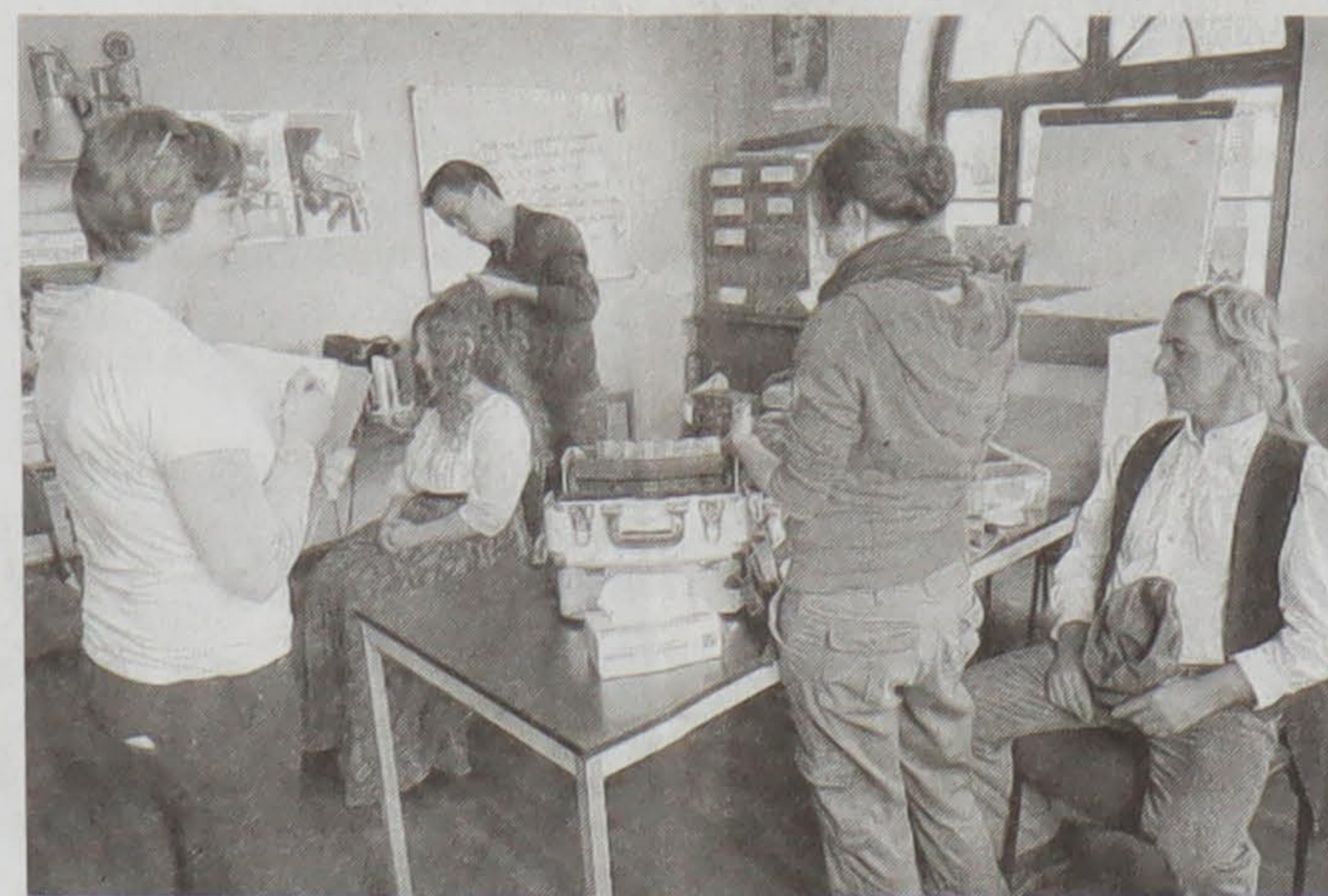
La régisseuse veille au maquillage des figurants.

Une manière pour lui d'exalter l'heureux temps de l'enfance et de faire un cadeau peu banal à ses deux garçons, leur permettant de transformer leurs rêves en réalité.