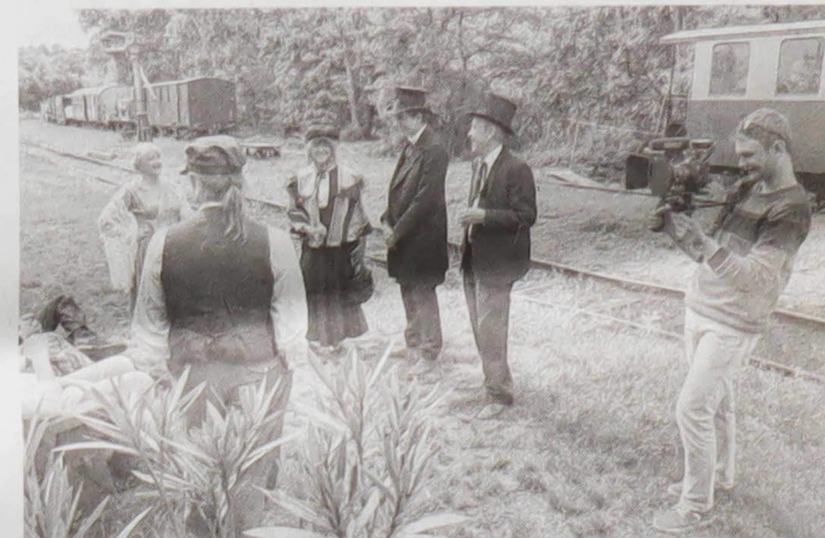
Un caméraman de la société de production Synovie a filmé les à-côtés du tournage.

« L'histoire démarre à l'époque actuelle et met en scène un enfant défavorisé, qui le jour de son anniversaire reçoit pour seul cadeau un petit carreau de chocolat », explique Olivier Arnold. « Déçu, le petit garçon s'invente un monde meilleur et s' imagine en Indien attaquant les voyageurs d'un train bourré de chocolats », poursuit le réalisateur dans un large sourire.